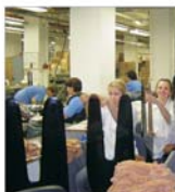
Înt-un an, "Adesgo" produce ciocari "Diamond" pentru 20 de milioane de femei