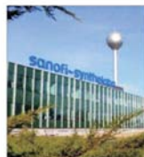
60 de miliarde de dolari - oferta "Sanofi" pentru achiziția "Aventis"