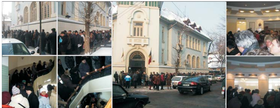
Dimineața geroasă. Ești întreprinzător. Te așezi la coadă. Până ajungi să intri pe poarta Administrației financiare, durează o oră. În vestibul continui să tremuri. Urci scările în ritm de trei trepte pe minut. În sala ghișeilor te mai învirezi, încălzit de grămadă: ai intrat în Paradis. Mai aștepți o oră. Ajungi în fața și dai de dracu', ca să plătești taxele. Afacerile au devenit o religie fiscală...

● Înnebuniți, contribuabilii acuză Guvernul că ar fi adoptat normele de aplicare a Codului fiscal joi, le-a publicat vineri, iar termenul limită pentru depunerea declarațiilor l-a stabilit pentru duminică! ● Administrațiile Financiare au decis să accepte declarații și luni ● "Guvernul ne ține în tensiune ca să nu gândim", acuză micii întreprinzători