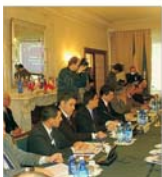
Un deceniu de parteneriat NATO