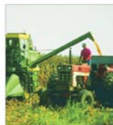
Bruxelles-ul este interesat de sectorul nostru de agricultură ecologică