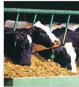
Importurile ieftinesc prețul furajelor