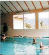
"Balneoclimaterica Sovata" a contribuit cu 1% la veniturile "Danubius"