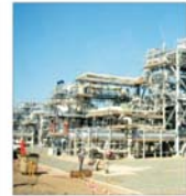
"Lukoil" vrea să acapareze cît mai mult din piața americană