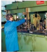
Iran și Egipt sînt principalele piețe externe ale "Hidrojet" Breaza