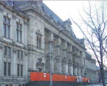
CENZURA APLICATĂ PRIN JUSTIȚIE

Inițiala a baronei Emma Nicholson s-a propunat suspendarea negocierilor de integrare a României, datorită suspiciunii că autoritățile noastre au încălcat angajamentele, în privința adopției de copii, în perioada crizei. Societatea Academică Română (SAR) a acuzat Guvernul că limitează libertatea presei prin pîrgîșii fiscale, astfel că, tolerîndu-le acumularea de urșate datorii către buget, își asigură o pondere mass-media. Răzîndu-se să mai propună suspendarea negocierilor cu România, baroana Emma Nicholson a preluat, însă, problema libertății presei și a inclus-o printre cele care urmează să fie monitorizate de Uniunea Europeană.