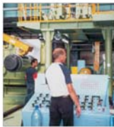
"Otelinox" Tirgoviste întinde creșterea producției cu 12%