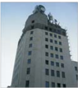
"Romtelecom" va disponibiliza în acest an 3.500 de salariați