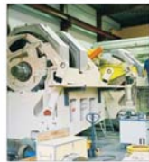
Materile prime - o problemă mondială