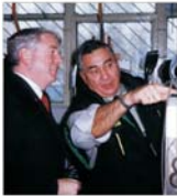
Corererea de pe piața britanică crește producția firmei "Celsius 2000"