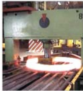
"Artego" Tirgu Jiu și-a dublat profitul