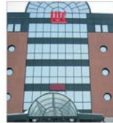
"LUKOIL" vrea să reinvie un contract de peste 7 miliarde de dolari cu Irakul