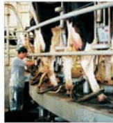
"Fermierii nu au acțiuni la firmele din industria alimentară"