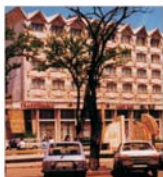
"Turism Transilvania" Cluj Napoca vrea profit cu 44% mai mare în acest an