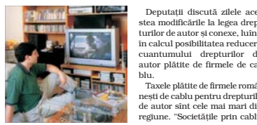
Deputatul discută zilele acestea modificările la legea drepturilor de autor și conex, fiind în calcul posibilitatea reducerii cuantumulului drepturilor de autor plătite de firmele de cablu.

● Reprezenții companiilor de CATV susțin că l-au convins pe parlamentari să reducă taxele pentru drepturile de autor ● Comisia pentru cultură și arte din Camera Deputaților a acceptat reducerea taxelor pentru societățile de cablu de la 6,2% la 2% din valoarea abonamentelor