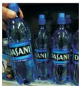
"Coca-Cola" retrage apa Dasani de pe piața britanică