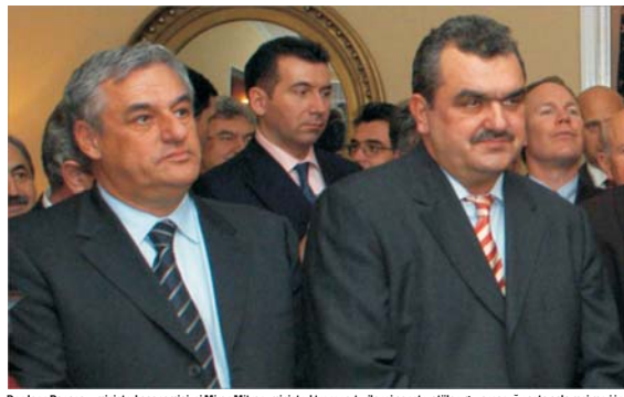
Dan Ioan Popescu, ministrul economiei, și Miron Mitrea, ministrul transporturilor și construcțiilor, guvernează peste cele mai mari investiții din România.