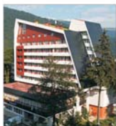
Vinzările "Internațional" Sinaia s-au dublat