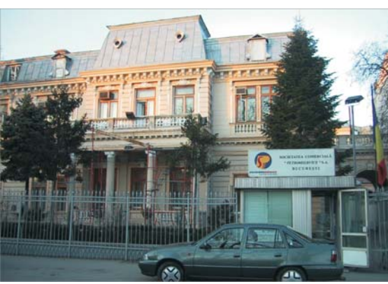
Acționarii SNP "Petrom" au aprobat, ieri, vânzarea clădirii din strada Budapesta (foto), unde, în prezent, își are sediul compania "Petromservice". Prețul de pornire la licitație, pentru clădire și terenul de aproape 1.670 de mp, va fi de 490.000 de euro