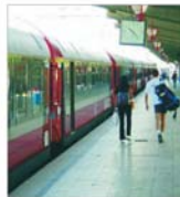
Modernizarea coridoarelor europene va necesita 5,13 miliarde de euro