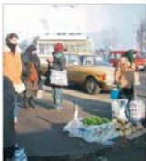
Creșterea economică a fost de numai 1% pe an