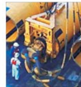
Statul rus și-ar putea majora participația la "Gazprom"