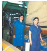
"Frotieryer" SA se pregătește pentru participarea la Târgul Heimtextil de la Frankfurt