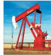
Prețul petrolului atinge maximul ultimei săptămâni