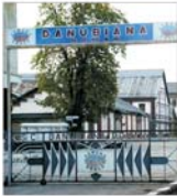
Disponibilități la "Danubiana" Roman