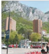
"Hercules" Baile Herculane produce, începând de anul trecut, berea "Hercules"