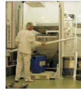
Obligativitatea GMP scoate din piață mulți producători de medicamente