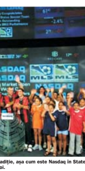
Deschiderea cu spectacol a bursei cu tradiție, așa cum este Nasdaq în Statele Unite, va deveni o practică curentă și la noi.

Bursa de Valori își va deschide sediul de tranzacționare în mod oficial în fiecare săptămîna. O persoană publică importantă va participa la deschiderea fiecărui sedințelor bursiere de luni. Au fost invitate personalități politice, reprezentanți ai unor instituții internaționale, oameni de afaceri de succes, sportivi, artiști și oameni de cultură. Primul invitat care va deschide sedința de luni este chiar președintele României, Ion Iliescu.