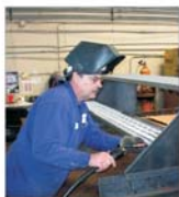
Valoarea investițiilor la 'Nicovala' SA Sighișoara ajunge la circa 400.000 euro