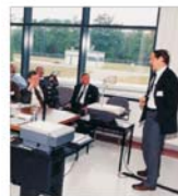
Fuziuni și achiziții de 38,6 miliarde de dolari în Europa Centrală și de Est