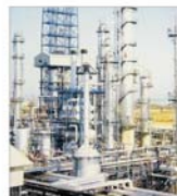
Prețul petrolului Brent va atinge o medie de 29 dolari/bari în acest an