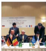
Șantierul Naval 'Daewoo' Mangalia a semnat un contract de 200 de milioane de dolari