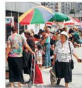
Prefectura și Ministerul Agriculturii și-au dat mina peste... piețe!