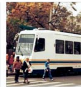
Consorțiul "Imst-ABB" a contractat o lucrare de 3,55 milioane euro de la RATB

Ai grijă ce îți dorești, este posibil să obții. Ralph Waldo Emerson