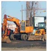
"Bega Mecanica" SA Negreșii Oaș a asimilat în fabricație peste 18 produse noi, destinate exportului