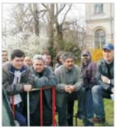
Sindicaliștii de la CSR au protestat în fața Guvernului