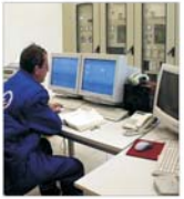
Strategie de dezvoltare durabilă a sectorului energetic pentru următorii douăzeci de ani