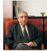
"Imasr" București vrea să-și tripleze cifra de afaceri până în 2007