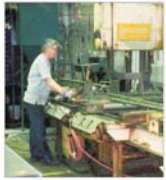
"Laromel" București vrea o creștere cu 20% a rezultatelor financiare în 2004