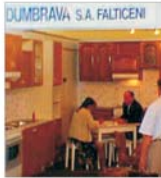
"Dumbrava SA Fălcițeni" vrea să se mențină pe piața externă