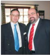
"Allied Telesyn" atacă locul doi mondial în soluții de rețea