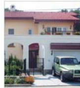
"SGA România" anunță sfârșitul furtunii pe piața apartamentelor