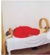
Vinzurile "Tratament Balnear Buzias" s-au majorat cu 16%