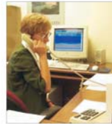
Deschiderea pieței a stimulat dezvoltarea serviciilor de telecomunicații