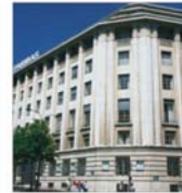
"BNP Paribas" SUA - investigată pentru practici ilegale