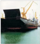
"Daewoo" Mangalia pierde zilnic 800.000 dolari