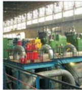
PLASAMENTE ALTERNATIVE Actualitatea contemporanilor