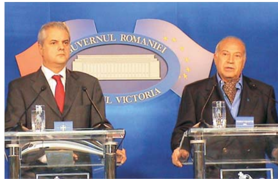
Problema impozitării profitului la adus, din nou, la aceeași tribună, pe premierul Adrian Năstase și pe Dan Voiculescu, președintele PUR, fostul partener de guvernare al PSD.

● Fimele vor putea să aleagă între neimpozitarea profitului reinvestit și amortizarea accelerată ● Măsura va fi prevăzută în varianta modificată a Codului Fiscal, care va intra în vigoare de la 1 ianuarie 2005