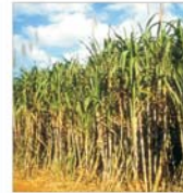
Piața zahărului își pune bazele pe exportul din Brazilia