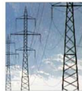
Moldova a anulat licitația pentru companiile de distribuție electrică