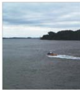
Podurile peste Dunăre vor fi gata în trei ani