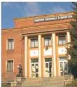
CNH va face cadou 160 hectare de teren administratiilor locale din Valea Jiului