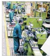
"Turbomecanica" București: vânzări de 22 de milioane de dolari în 2003