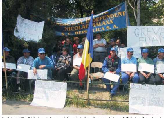
Numerul salariaților aflați în stare critică a crescut ieri la șapte, foștii muncitori care au declanșat săptămîna trecută greva foaielor rezinate în continuare asistență medicală.

Autoritatea Națională de Control (ANC) a constatat că managementul de la "Republica" s-a sustras de la plata drepturilor salariale în perioada martie - octombrie 2003, prin derularea unor operațiuni frauduloase. Conducerea uzinei a vîndut o parte din activele societății, fără licitație, prin procedura negocierii directe, către Tehnologika Tub/SRL la o valoare subevaluată. Activele au fost vîndute cu 122,2 miliarde lei, față de valoarea evidențiată în contabilitate, de 267,4 miliarde lei. Sumele incasate efectiv de "Republica" de la cumpărătorul activelor (în valoare de 1,4 milioane dolari) au fost apoi restituite, în marea lor majoritate, chiar firmei respective în contul unor datorii. Numai 7% din sumele respective au fost direcționate către plata salariilor, deși existau obligații asumate