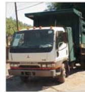
Arestări la "Mitsubishi" - rapoarte false privind siguranța autovehiculelor