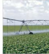
AVAS a vândut instalații de irigații și pachete agricole în valoare de 4,767 milioane dolari