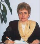
În curind, de la "Marama Musculeană" va dispărea... marama