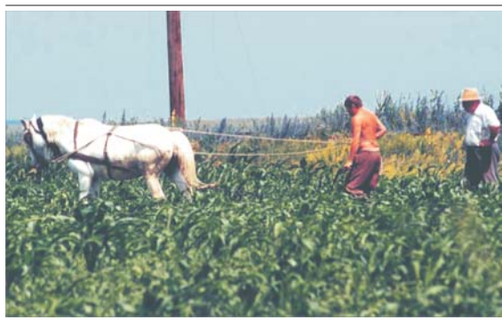
Calul, țărani și investitori...

• Premierul se vaită că țărani își vând ieftin terenurile, în condițiile în care Guvernul nu a făcut mai nimic pentru constituirea unei piețe funciare reale • Cu cât se așteaptă premierul să își vândă țărani pământul, când pensia lor este de 15 euro? • Licităția pentru pământul românesc poate să înceapă de la 430 de miliarde de euro