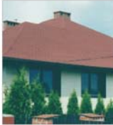
"Matizol" și-a dublat profitul, dar vânzările au rămas la nivelul din 2002