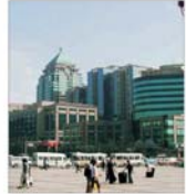
China vine în sprijinul ofțelurilor europene