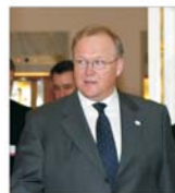
Opportunități de investiții pentru firmele suedeze în țara noastră