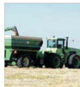
2003 - anul investițiilor la "Comerecra" Bihor