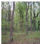
Regia Pădurilor va investi din fonduri proprii aproape 700 de miliarde de lei în 2004