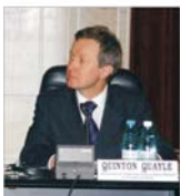
Guvernul a lansat strategia de reformă a administrației publice