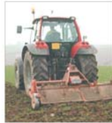
Ministerul Agriculturii a plătit jumătate din totalul subvenției pentru tractoare

ZIARUL BURSA ESTE PRIN JUSTIȚIE Despre anumite companii PROHIBIT ÎN ESTE ZIARUL "BURSA" să publice informații