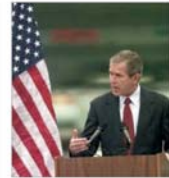
Bush nu se atinge de rezervele petrolului de stat