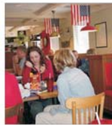
Operatorul restaurantelor "Piza Hut" și KFC din Polonia își listează acțiunile