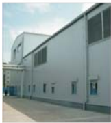
Investiție "Lek" de 12 milioane de dolari la Tirgu Mureș