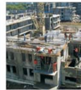
În București, ANL a epuizat tot stocul de proiecte rezidențiale