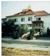
"Construcții Feroviare Moldova" lași va investi peste 16 miliarde de lei în acest an