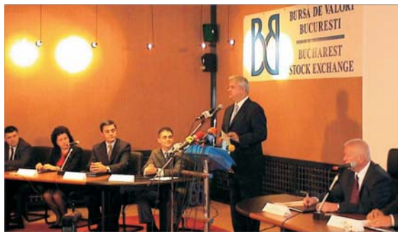
Adrian Năstase a prezentat, ieri, programul guvernamental "O piață puternică", în fața oficialilor pieței de capital.

Investitorii vor putea tranzacționa titluri de stat începînd din toamnă • Listarea a șapte societăți la Bursa, precum și crearea pieței secundare a titlurilor ipotecare se numără printre măsurile pe care Guvernul le-a cuprins într-un program menit să contribuie la dezvoltarea pieței bursiere