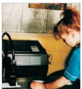
Guvernul alocă 60 miliarde de lei pentru dezvoltarea sectorului IMM