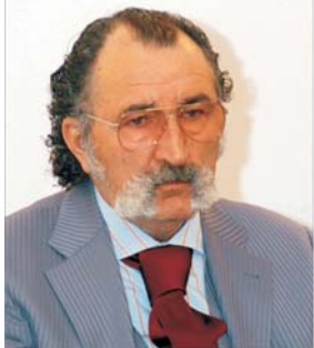
Prietenia dintre Ioan Țiriac și Ioan Rus consolidată și de contractele cu statul.

● Societatea "Construcții Napoca", abonată la contractele de stat ● Compania clujeană, în care ministrul administrației și internelor, Ioan Rus, a fost acționar indirect, a primit contracte de miliarde de lei chiar de la instituții subordonate Ministerului de Interne ● În același timp, Ministerul Finanțelor l-a calculat penalități de 2,5 miliarde de lei pentru neplata la termen a obligațiilor bugetare ● Recent, compania "Napoca" a câștigat contractul de aproape 90 de miliarde de lei pentru modernizarea stadionului "Ion Moina" din Cluj, licitație organizată de Consiliul Județean Cluj, dar Ministerul Administrației și Internelor nu are cunoștința de acest contract