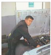
"Automecanica" Mediaș țintește exporturi de 70% din producție