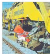
"Secol" Italia a început construcția unei noi linii ferate pentru CFR