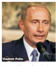
Putin a făcut referire la diversificarea căilor de export al țițeiului.

Pe de altă parte, Putin a cerut un mare multă transparență în afacerile dintre stat și companiile petroliere.