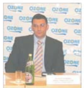
"Ozone Laboratories" va investi 14 milioane euro pînă în 2006