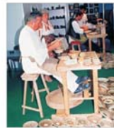
Aproape 500 de firme își prezintă produsele la a XXI-a ediție a TIBCO