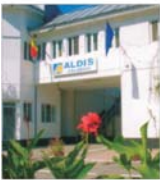
"Aldis" a investit 70 de milioane de euro pentru alinierea la standardele europene