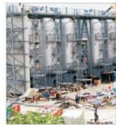
"Gazprom" a pus ochii pe "Lukoil"