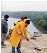
"Hidro tehnica" Galați a contractat lucrări de 133 miliarde de lei pentru acest an