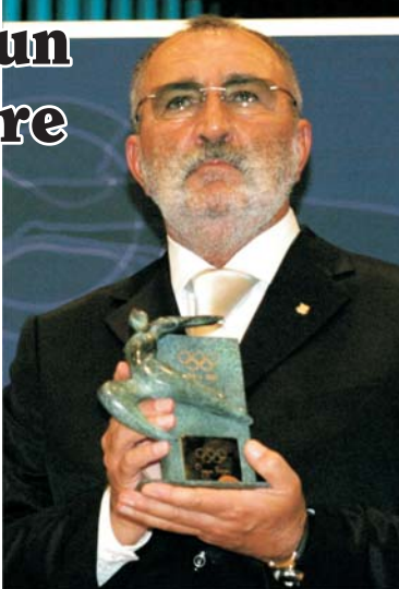
Fostul mare tenisism, Ion Țiriac, s-a obișnuit cu trofeele...

La cerb, pentru exemplarele caracteristice arealului din Almasu Mare, prețul variază între 850 și 6.300 de euro, cu aceleasi costuri colaterale organizării vînătorilor.