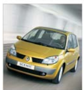
"Renault România" estimează vânzări de 400 de unități Scenic II