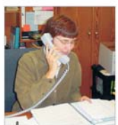
Densitatea telefoniei fixe va crește în următorii ani