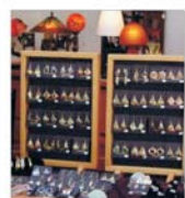
Patronatul Bijuteriilor cere eliminatoria acțiunilor la bijuteriile din aur