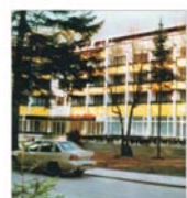
"Monessa" SA oferă turiștilor cazare în hoteluri și vile de 2 și 3 etaje