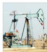
Cererea mondială de țitei va înregistra cea mai mare creștere din ultimii 24 de ani