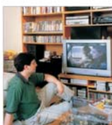
90% din produsele "Daewoo Electronics" sînt ecologice