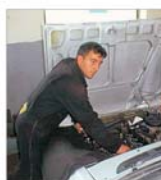
"Automobilele Dacia" - principalul beneficiar al "Componente Auto"