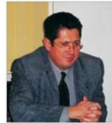
Gestionea informatică a resurselor umane determină reducerea costurilor companiilor