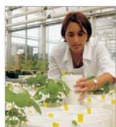
"Semrom Montania" București vrea profit de 40 miliarde de lei în acest an