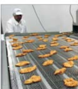
"Agricola" atacă piața seminipreparatorilor