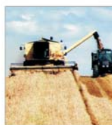
Autoritățile au inițiat măsuri de calmare a pieței grâului