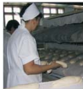
Produsele "no name" au afectat activitatea producătorului "Bega Pam"