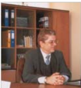
"Valmedica": Un distribuitor de medicamente rezistă pe piață doar prin infuzie de capital străin