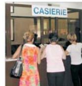
Firmele ușoare oculesc creditele acordate din fondul de șomaj