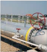
"Romgaz" a investit 42 milioane de dolari în depozitul de imagineare a gazelor Bîlculeștii