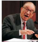
Alan Greenspan, în sprînjinalul dolarului