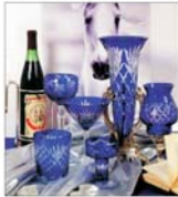
"Falmar" Baia Mare exportă peste 90% din producție