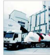
"Holcim România" a investit 3,5 milioane de euro în modernizarea fabricii de ciment din Turda