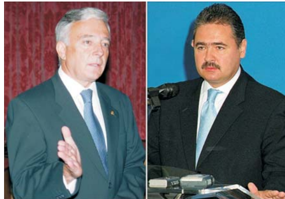
Ministrul de finanțe, Mihail Tănăsescu (dreapta), și guvernatorul BNR, Mugur Isărescu sînt încrezători că inflația se va încadra în ținta de 9%. Analiștii "Economist Intelligence Unit" nu sînt la fel de optimiști...

● Prognozele analiștilor occidentali vin în contradicție cu optimismul autorităților noastre privind încadrarea în inflația programată, de 9% ● În prima jumătate a anului, inflația a fost de numai 3,7%