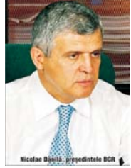
Nicolae Dănilă, președintele BCR

Banca Comercială Română (BCR) a obținut în primul semestru al acestui an un profit net de 3,613 miliarde de lei (aproximativ 89 milioane de euro), în creștere cu 46,2% față de aceeași perioadă a anului trecut, informează un comunicat al băncii. Activele totale ale BCR s-au majorat de la începutul anului cu 13,4%, ajungînd la 202.116,6 miliarde de lei (aproape 5 miliarde euro), iar capitalul propriu au crescut cu 6,1%, la 31.938,5 miliarde de lei. Banca și-a păstrat poziția de principal finanțator al economiei reale. Solulul creditorilor la finele primului semestru din 2004 a fost de peste 90.000 mil-