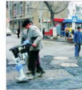
Construcții pun în pericol finanțările SAPARD din cinci comune ieșene