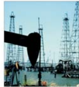
Piața petrolului - tot mai nervoasă