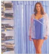
"Siretul" Pașcani exportă 60% din producție