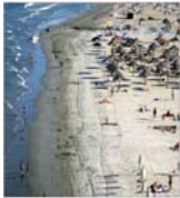
Sezonul estival de pe litoral este mai slab decât cel de anul trecut