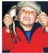
22,5 milioane euro - fonduri nerambursabile pentru creșterea braștelor comestibile