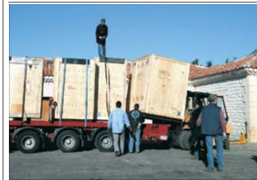
Inspectorii Primăriei Capitalei au continuat acțiunea de control și au sancționat conducătorii auto care au încălcat restricțiile de circulație, se arată într-un comunicat de presă remis redacției. În acest sens, în prima săptămîină a lunii august, au fost întocmite 204 procese verbale însumînd amenzi de 10,2 miliarde de lei. Primăria Capitalei nu a fost instigată, nici pînă în momentul de față. În mod oficial, de suspendarea efectelor Hotărîrii CGMB nr.106. În situația în care instanța s-ar pronunța cu privire la suspendarea acesteia, Primarul General a emis Dispoziția nr. 601/02.08.2004, obligatorie pe teritoriul Municipiului București, prin care a instituit aceleași restricții.

• Municipalityea va discuta, în toamna acestui an, cu un grup de lucru al patronatelor din construcții