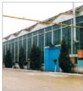
Investiții de 13 miliarde de lei la "Technofin" în primul semestru