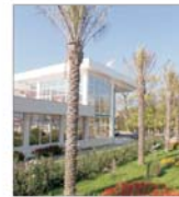
Peste 300.000 euro au fost investiți în noul sezon de lux "Palm Beach"