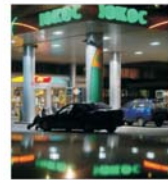
Principala divizie de producție a "lukos" - din nou sub sechestru