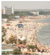
A. P. Mamaia își oferă serviciile pentru reintroducerea stațiilor în circuitul european