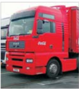
Vinzurile "Coca-Cola HBC" în țara noastră - influențate de vremea nefavorabilă