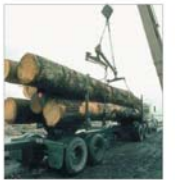
"Curtea de Argeș Foresta": vinzurile s-au menținut aproape la același nivel ca anul trecut