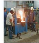
LNM preia controlul la "BH Steel" din Bosnia