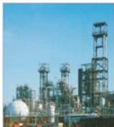
"Rompetrol Well Services" Ploiești - pierdere de 17,3 miliarde de lei în primul semestru