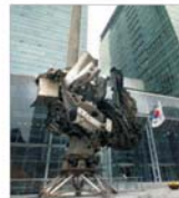
"Pasco" și "BHP Billiton" negociază construcția unui complex siderurgic în India