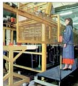
"Armătura" Cluj-Napoca și-a majorat profitul semestrial din exploatare