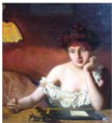
PLASAMENTE ALTERNATIVE O licitație în plină vară