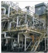
"Chimopar" București a trecut de pierdere la profit după primul semestru