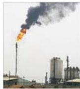
SUA trebuie să-și folosească rezervele strategice de petrol ca să calmeze piața