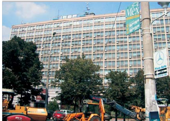
Compania "Termoelectrica" ar avea probleme majore dacă creditorii ar cere rambursarea accelerată a sumelor trase.

• Administratorii companiei spun că situația financiară a societății este deosebit de dificilă, din cauza pierderilor acumulate (1.6.600 miliarde de lei) care egalează capitalul social