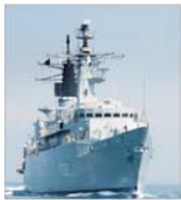
Fregata "Regele Ferdinand" și-a încheiat cu succes teste