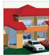
"Energi-Co Holding" construiește 74 de vile în Giulești