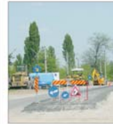
SAPARD a inaugurat două proiecte de infrastructură rurală în valoare de 2 milioane de euro