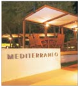
Vara capricioasă a mînit vînzirile unităților de alimentație publică din centrul stației Neptun