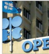
OPEC anticipează scăderea prețului petrolului începînd cu această lună