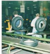
"Danubiana": investiții de peste 30 miliarde de lei în primul semestru