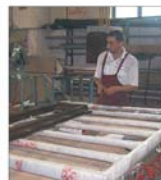
A lașă ființă Patronatul Producătorilor de Timpărie Termoizolantă