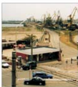
BERD a acordat un împrumut de 16 milioane euro portului Constanța