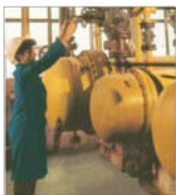
Peste 60% din producția realizată la "Carbid-Fox" se exportă în peste 50 de țări