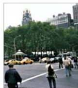
OECD își revizuieste în sens negativ previziunile pentru cea mai mare economie a lumii