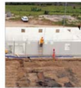
'Apa Nova' București a inaugurat lucrările de construire a stației de tratare a apei Crivina