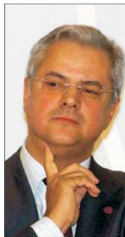
"Dracula Park" nu înseamnă neapărat un tip care îi înșeapă pe alții sau care dă țepe altora. Este un proiect turistic ca oricare altul" (Adrian Năstase, 3 Iunie 2003)

• Aproximativ 60 de hectare vor fi scoase din circuitul agricol • Printre beneficiarii cedării gratuite a terenului se va număra chiar premierul Adrian Năstase, care a investit 100 de milioane de lei în "Dracula Park"