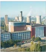
Grant de 220 de mil de dolari pentru ELCEAN