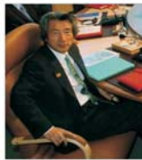
Cabinetul nipon - remaniat