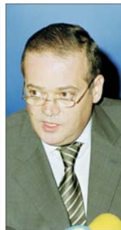
"Dracula Park" este un proiect sūtă la sūtă privat (...)" (Dan Matei Agathon, 30 Iunie 2003)

Suprațată de aproximativ 460 de hectare de lîngă Snagov va fi concesionată cu titlu gratuit societății care administrează proiectul "Dracula Park", potrivit unui proiect de hotărîre de Guvern care va fi aprobat, cel mai probabil în această săptămîna. Terenul va fi concesionat pe o perioadă de 49 de ani, cu posibilitatea prelungirii pînă la 99 de ani. Timp în care statul nu va încasa nici un leu din concesionarea terenului.