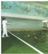
'Turism Felix' vrea să investească 46 miliarde lei, anul acesta