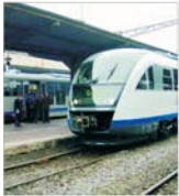
Noile trenuri Săgeata Albastră vor fi introduse în circulație la 1 octombrie