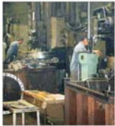
"Utor" Onești țintește o cifră de afaceri de peste 250 miliarde lei