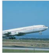
Industria transportului aerian va pierde pînă la 4 miliarde de dolari în acest an