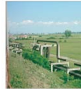
Terenurile comerciale din Timișoara și-au dublat valoarea față de anul trecut