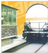
"Balanta" SA Sibiu exportă în Ungaria, Germania, Italia