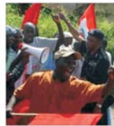
Grevă națională în Nigeria