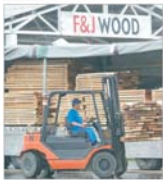
F&J lansează noi investiții, de milioane de dolari, în țara noastră