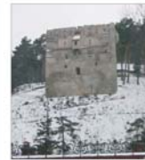
Reabilitarea Zidurilor Brașovului medieval costă 600.000 euro