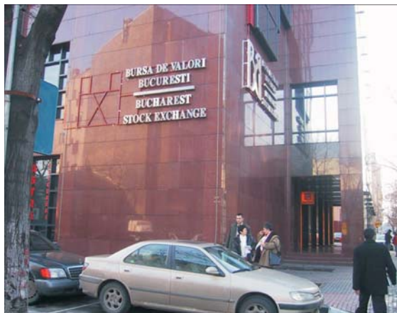
Brokerii au amintit transformarea Bursii în societate pe acțiuni pentru la anul.

Brokerii au amintit pentru început anulului vitor transformarea Bursii în societate pe acțiuni, deși ar fi avut ocazia să o facă ieri, la Adunarea generală care s-a desfășurat în sedul Burselor. De ordinul de zi a ședinței, subiectul a figurat la capitolul "dezbateri", iar nu la "decizii", deși, de mai bine de un an și jumătate, Asociația brokerilor susține că vrea să accelereze procesul de fuziune dintre