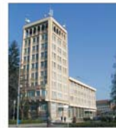
Consiliul Județean Vâlcea va activa într-o sediu modern