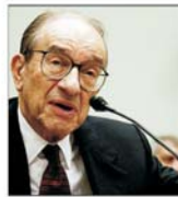
Fed va surprinde piața printr-o majorare a dobânzii în luna decembrie