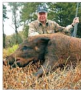
Vinătorii străini, selectați de intermediari prin Internet pentru partide de vinificație la Satu Mare