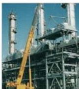
"Foraj Sonde" Videle vrea profit brut de 4,3 miliarde lei