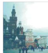
Companiile ruse vor fi luate la bancă marșuri de autorizație fiscale