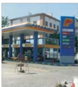
SNP "Petrom" București: profit net mai mare cu 88%