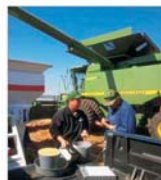
Producția de cereale pe cap de locuitor a crescut în 2004