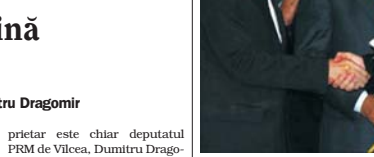
În vară, autoritățile române au bătut palma cu conducerea OMV pentru vizarea "Petrom".

Parlamentarii, cazați la hotelul deputatului PRM Dumitru Dragomir Biroul Permanent al Camerei Deputaților a primit sere aprobare un memorandum intern privind cazarea parlamentarilor din provincie la hotel în luna decembrie 2004, respectiv în anul 2005. Pînă acum, hotelul București îl găzduia de deputații din provincie, însă întrucît acesta se află în renovare, au fost înaintate solicitări și altor unități pentru cazarea parlamentarilor. Din toate ofertele primite, unitatea hotelieră ce se apropie cel mai mult de cerințele impuse de departamentul Camerei Deputaților - care se ocupă de cazarea parlamentarilor, si care are un tarif identic cu cel practicat de Hotelul București, s-a dovedit a fi Hotelul "Crystal Palace", al cărui pro-