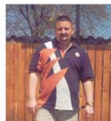
"Interesele de grup restrîng piața locală pentru constructorii constanțeni"