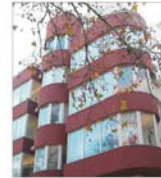
Tot mai multe IMM-uri vor să se întindă în clădirii de birouri de clasă B