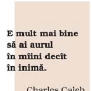
Charles Caleb Colton