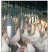
Zootehnia mai are încă doi ani să se pregătească pentru adăru