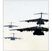
Directorii "Inkos" au părăsit Rădăuți