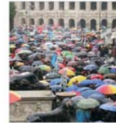
Grevă în sectorul serviciilor din Italia