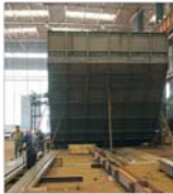
"Rotez" Buzău a programat investiții de peste 2 milioane de euro