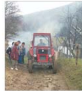
Peste 70% din parcul de mașini și utilaje agricole din țara noastră are vîrsta depășită