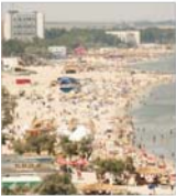
Concursul TUI și-a propus să ajungă la un volum de 100.000 turiști pe sezon