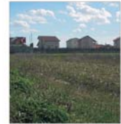
Terenurile sint camioanele tranzacțiilor de pe piața imobiliară bucureștenă ○ pag. 12

Să ceri de la viață imposibilul, pentru că posibilul este întotdeauna limitat. Anonim