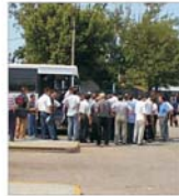
Transportatorii rutieri amenință cu ample mișcări de protest