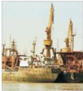
Compania APM SA a realizat investiții de peste 750 milioane lei în portul Constanța