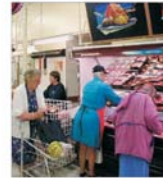
Război sângeros între marile lanțuri de hypermarketuri pentru acapărarea pieței