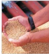
"Semrom Mautenia" SA București - depășire de circa 10% a profitului programat