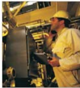
"Com.B." Săvinești a investit peste 170.000 dolari, anul trecut