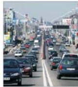
Ilfovul are nevoie urgentă de 280 milioane euro, pentru investiții