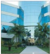
Veniturile KPMG au crescut cu 16,4%