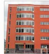
Firmele mici și medii vor să-și cumpere spații de birouri